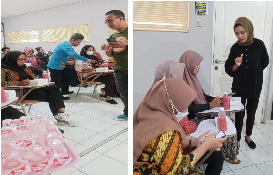
Gambar 2 Praktik dan Monitoring Pembuatan Konten Marketing

Setelah tahap pengunduhan aplikasi selesai hal pertama yang diajarkan kepada peserta pelatihan adalah cara untuk membuat desain logo merek melalui aplikasi. Logo merupakan bentuk identitas visual yang memiliki karakteristik berbeda pada masing – masing produk. Karakteristik tersebut dapat berupa warna, bentuk huruf, dan filosofi lainnya. Dengan adanya sesi pembuatan logo, peserta didorong untuk berinovasi dengan menggabungkan elemen untuk membuatnya. Mulai dari sketsa, gambar, tulisan maupun tagline yang menandakan identitas masing – masing produk. Adanya logo atau desain khusus tersebut dimaksudkan untuk memberikan nilai tertentu dalam benak konsumen. Dengan memiliki ciri khas, diharapkan produk memiliki diferensiasi dengan produk yang sejenis dan mampu untuk melekat dan menarik di benak konsumen sehingga menimbulkan rasa ingin tahu hingga membeli produk tersebut.