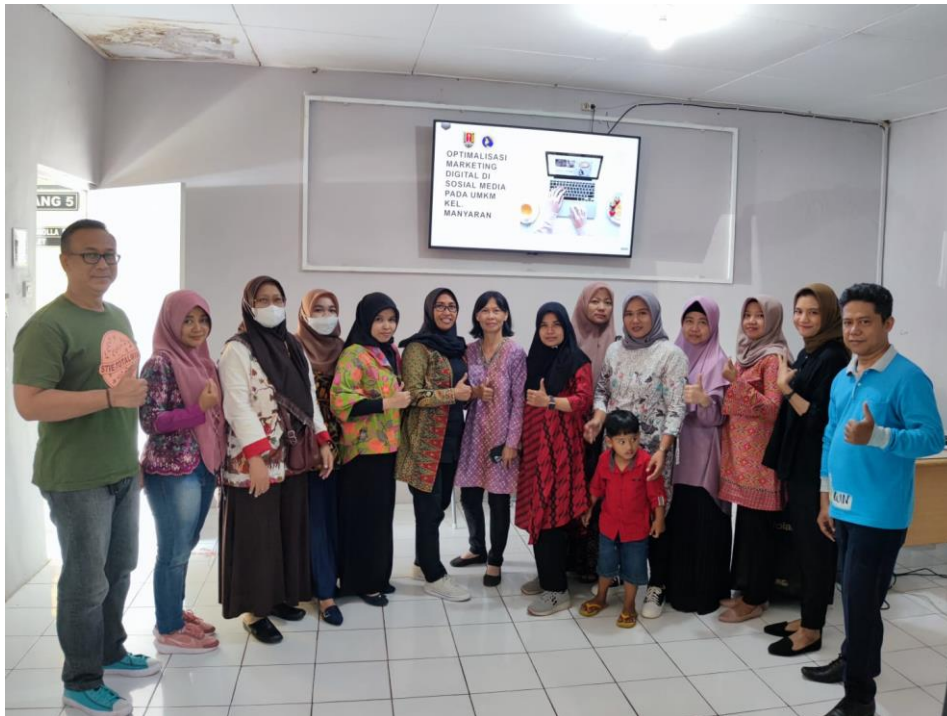
Gambar 1 Bersama perwakilan peserta pelatihan

Langkah awal kegiatan dengan pengenalan aplikasi pendukung untuk pembuatan konten media sosial dirasa penting karena cukup banyak peserta yang sudah menggunakan platform media sosial, namun belum mengoptimalkan pemasaran melalui platform digital tersebut. Pembuatan konten yang menarik dinilai tidak mudah karena sebagian besar dari peserta kurang memahami fungsi dari aplikasi pendukung untuk tahap editing. Pada kondisi ini, selain mengenalkan aplikasi pendukung editing untuk pembuatan konten marketing digital, peserta pelatihan juga diarahkan untuk mengunduh aplikasi terkait melalui perangkat masing – masing dan mencoba berbagai fiturnya.