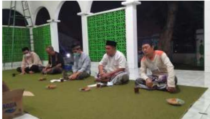
Gambar 2. Kondisi Kegiatan Motivasi Terkait Pentingnya Pelaporan Keuangan Masjid

Kegiatan pemaparan dilaksanakan pada tanggal 17 Februari 2021, yang dihadiri oleh Pengurus RT 003 RW 003 dan Pengurus Takmir Masjid Al Mubarak. Pada kegiatan ini dipaparkan mengenai pentingnya Pelaporan Keuangan Masjid. Pemaparan tentang kenapa perlu laporan keuangan masjid, pentingnya laporan sebagai informasi keuangan, kegunaan laporan keuangan masjid, konsep dasar keuangan dan penyusunan laporan keuangan.