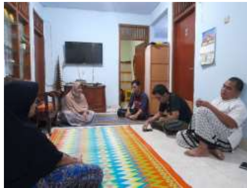
Gambar 4. Suasana Kegiatan pelatihan penyusunan laporan keuangan masjid dengan Ms. Excel,

Kegiatan pelatihan dilaksanakan pada tanggal 17 Februari 2021, yang dihadiri oleh Pengurus RT 003 RW 003 dan Pengurus Takmir Masjid Al Mubarak. Pada kegiatan ini dilakukan mengenai pelatihan penyusunan laporan keuangan masjid dengan Ms. Excel. Pembahasan pelatihan memaparkan tentang mengapa aplikasi excel?, pengenalan fitur aplikasi, Setting Identitas Masjid, Input Saldo Awal dan Anggaran Masjid, Mekanisame Pencatatan Transaksi Masjid, Pencetakan Laporan Masjid, Simulasi.