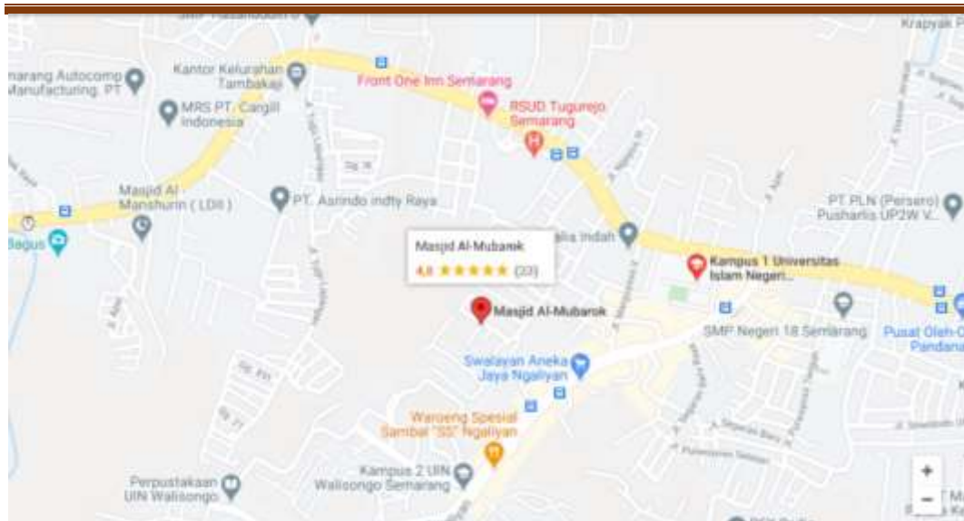
Gambar 1. Peta Lokasi Masjid Al Mubarak

Adapun rute menuju Masjid Al Mubarak dari arah kota Jl. Siliwangi terus lurus 3,1 Km ke Jl. Walisongo, belok kiri ke Jl. Pelem Kuweni 230 m, teruskan ke Jl. Sunan Kalijaga 59 m, belok kiri ke Jl. Sunan Bonang 110 m, teruskan ke Jl. Sunan Kudus 100 m, belok kanan ke Jl. Maulana Malik Ibrahim 70 m tujuan anda ada di sebelah kiri.