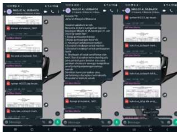
Gambar 7. Grup Masjid pada Whatsapp

Selain grup facebook juga di laporkan melalui grup whatsapp yang di tunjukkan pada gambar di bawah ini :