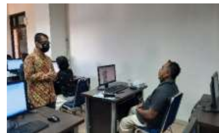
Gambar 4. Pemberian Materi Aplikasi Komputer Difabel