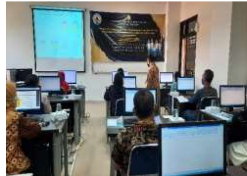
Gambar 3. Pemberian Materi Konsep Keuangan