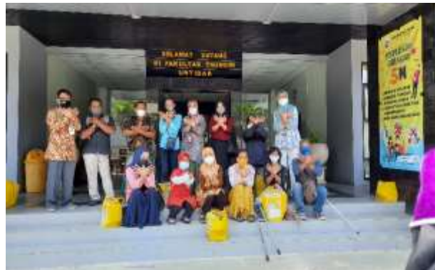
Gambar 5. Penerapan Sistem Yang Diajarkan Ke Peserta Difabel