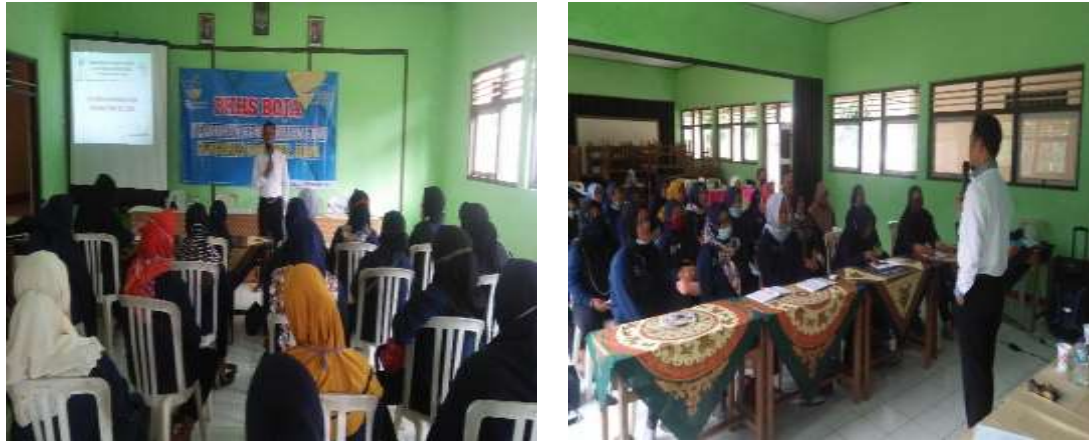
Gambar 3. Pelaksanaan Kegiatan Peningkatan Kapasitas KPM PKH