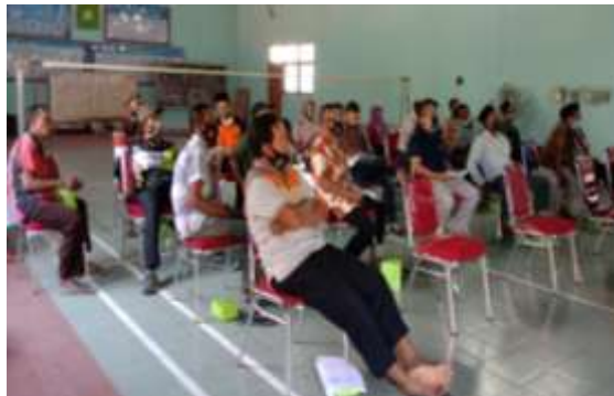
Gambar 5. Peserta yang antusias dalam kegiatan pelatihan

Gambar 5 menampilkan serangkaian kegiatan dari pelatihan, dimana semua peserta sangat antusias dalam mengikuti kegiatan pelatihan dengan ditunjukkan banyak peserta yang bertanya dan berpartisipasi memberikan usulan dan saran dalam kegiatan ini