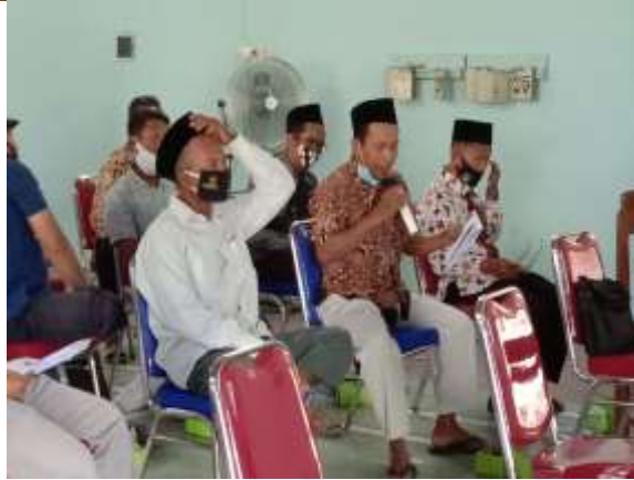
Gambar 4. Sesi Tanya jawab

Gambar 5 menampilkan serangkaian kegiatan dari pelatihan, dimana semua peserta sangat antusias dalam mengikuti kegiatan pelatihan dengan ditunjukkan banyak peserta yang bertanya dan berpartisipasi memberikan usulan dan saran dalam kegiatan ini