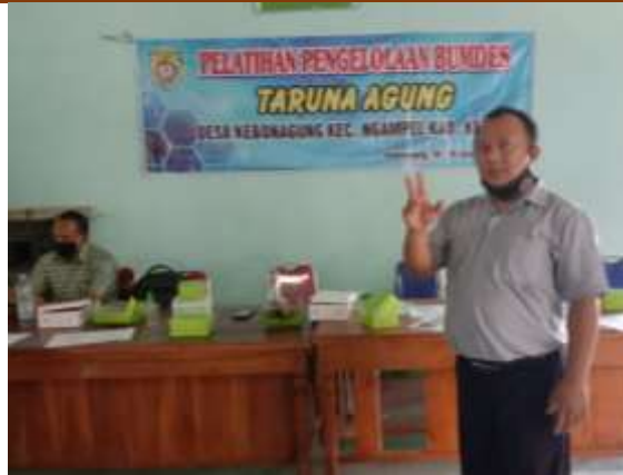
Gambar 2 Ketua Tim memberikan pelatihan dalam identifikasi potensi Desa Kebonagung.

Gambar 3 menampilkan anggota tim memberikan taambahan materi dalam identifikasi potensi Desa Kebonagung