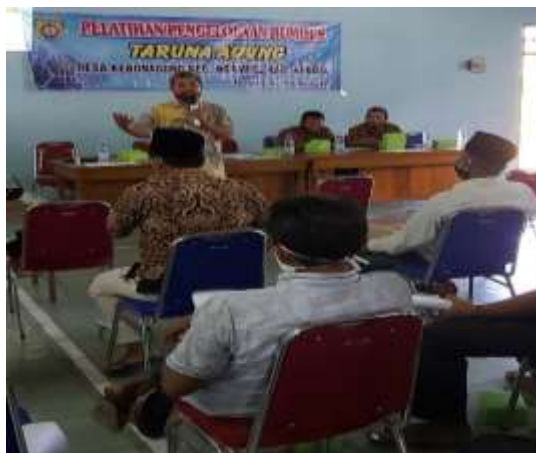
Gambar 3. Memaparkan materi dari anggota tim

Gambar 3 menampilkan anggota tim memberikan taambahan materi dalam identifikasi potensi Desa Kebonagung