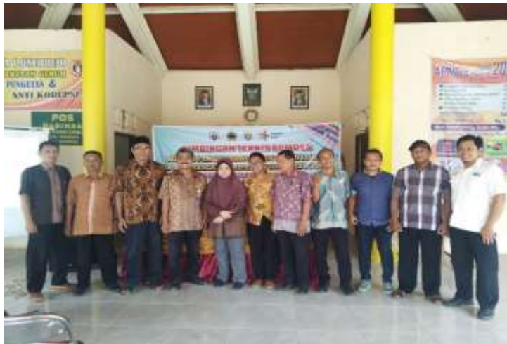
Gambar 6 Narasumber, Perangkat Desa, Pengurus BUMDesa

Dengan adanya pelatihan dan pendampingan pembuatan laporan keuangan sederhana ini diharapkan BUMDesa Desa Poncorejo akan dapat mengelola keuangannya dengan baik dan transparan. Semua pendapatan dan pengeluaran dicatat dengan baik sehingga akan mampu dibuat suatu anggaran yang tepat untuk pengelolaan selanjutnya. Adanya laporan keuangan yang transparan akan memunculkan kepercayaan dari masyarakat dan pemerintah desa pada khususnya dan pemerintah Kabupaten Kendal pada umumnya sehingga akan menjadi pemacu bagi BUMDesa Desa Poncorejo untuk berkembang dan harapannya akan semakin maju.