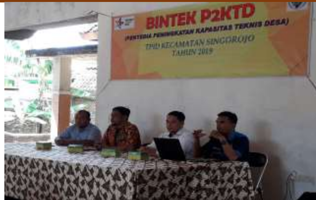
Gambar 3. bersama perangkat desa dan ketua BUMDesa, kegiatan bimbingan teknis

Jadwal identifikasi dan investigasi awal dilakukan pada tabel beserta dengan jadwal bimbingan teknis pengembangan pengelolaan Pasar Desa Ngareanak dan telah disepakati oleh semua unsur dari Pemerintahan Desa, Tokoh masyarakat, Masyarakat Desa Ngareanak dan pedagang Pasar Desa Mgareanak.