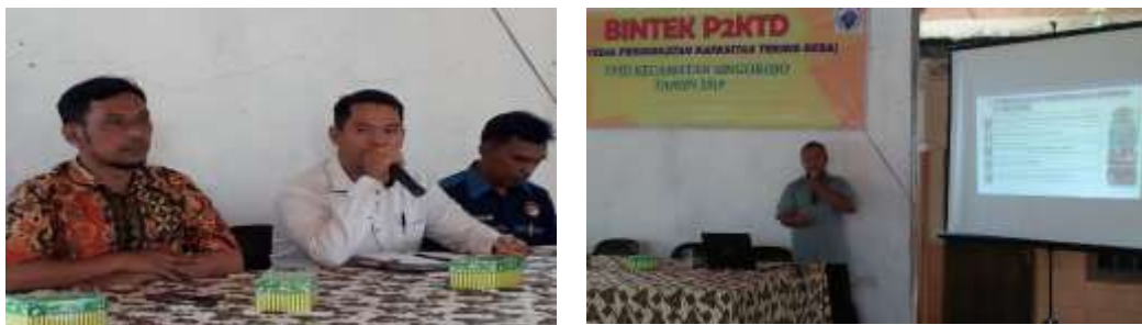
Gambar 2. Bimbingan teknis dan pendampingan pengembangan pasar Desa Ngareanak

Selain itu peserta bimbingan teknis juga dilatih untuk mengelola manajemen pasar dari kebersihan, keamanan, ketertiban serta dampak dampaknya. Pelaksanaan kegiatan bimbingan teknis ini dilakukan di Balai Desa Ngareanak, sedangkan tempat Pasar Desa posisi persis didepan Balai Desa Ngareanak. Sehingga dalam bimbingan teknis bisa langsung dijelaskan secara teori maupun secara langsung dilapangan sehingga bimbingan teknis berjalan dengan baik. Banyak yang mengajukan pertanyaan hingga suasana dalam bimbingan semakin kondusif, baik unsur pedagang, perangkat desa, pengurus BUMDesa dan TPK.