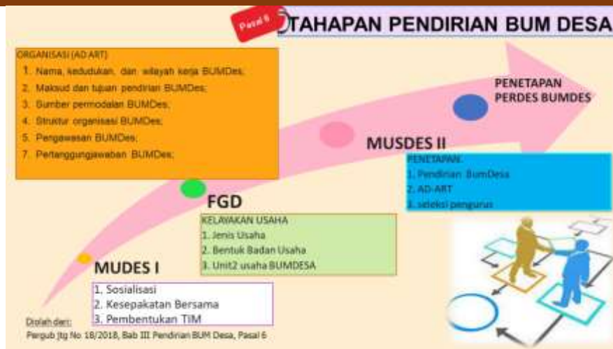
Gambar 3. Tahapan pendirian BUMDesa