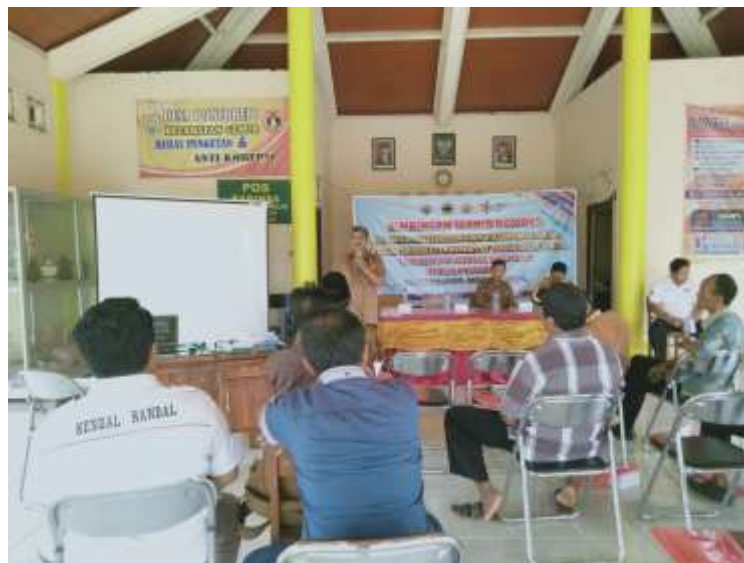
Gambar 1. Penyuluhan dan pendampingan pendirian BUMDesa Poncorejo

Peserta penyuluhan juga dilatih untuk menggali potensi yang ada di desa Poncorejo. Diutamakan potensi desa yang sudah berjalan dalam proses kegiatannya. Sekolah Sepak Bola (SSB) sudah berjalan beberapa tahun, dikelola oleh pemuda desa tersebut. Pelaksanaan kegiatan SSB tersebut dilakukan di tanah lapang yang juga milik Desa. Potensi yang bisa digali dari kegiatan ini ada dua hal, yaitu Sekolah Sepak Bola itu sendiri, dan tanah lapang yang bisa dijadikan tempat wisata lokal masyarakat disekitar. Tanah lapang yang bisa ditata ulang untuk tempat olahraga, dilengkapi dengan tempat pujasera disekitar tanah lapang, serta tempat permainan anak-anak. Kegiatan tersebut jika dikelola secara professional oleh BUMDesa akan mendatangkan pemasukan yang signifikan.