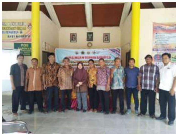
Gambar 2. Perangkat desa, Narasumber dan Karang Taruna, setelah kegiatan

Potensi desa lain yang bisa digali dalam penyuluhan tersebut, adanya tanah milik desa yang dipergunakan untuk usaha, bahkan sebagai tempat tinggal beberapa warga selama bertahun-tahun tanpa adanya pembayaran sewa ke Desa. Potensi ini bisa dikelola oleh BUMDesa untuk dibangun ruko-ruko tempat usaha, sehingga bisa disewakan kepada warga, terutama kepada warga yang telah lama memanfaatkan tanah tersebut. Selain potensi-potensi tersebut, masih banyak yang bisa digali tentang potensi usaha yang akan di kembangkan oleh pengurus BUMDesa, yakni pengelolaan air artetis, penampungan hasil pertanian dari hasil panen para petani di Desa Poncorejo, dan lain-lain.